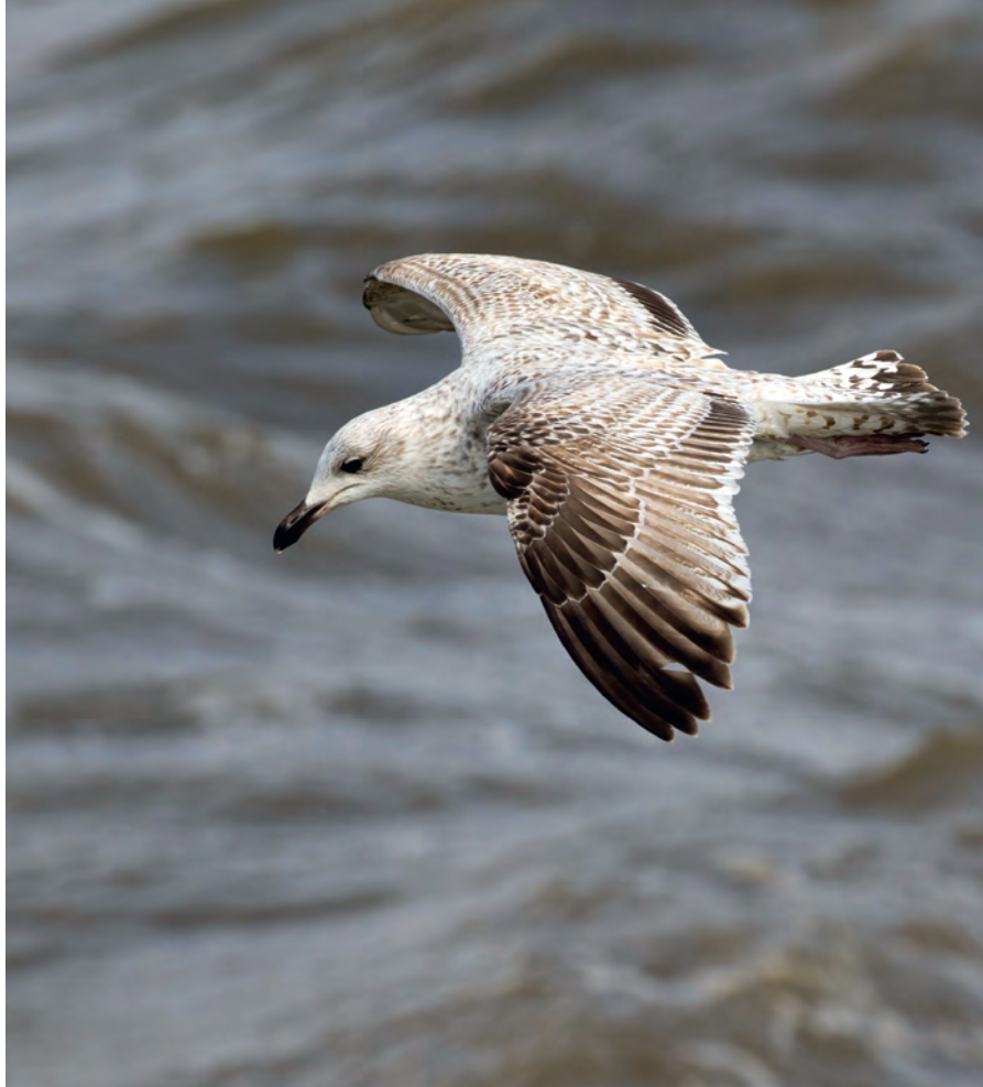
Zilvermeeuw, 2 de kalenderjaar

Tijdens zijn onderzoek heeft Camphuysen veel meeuwen goed leren kennen. Hij