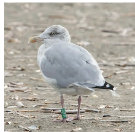
Groene ring met M.APP

herkent ze aan de vierlettercode op een groene plastic ring rond een van hun poten, waarmee inmiddels honderden vogels rondvliegen. F.AWL is een vrouwtje (F = Female) en partner van M.AVU; allebei zijn ze in 2015 geringd. Ze zijn erg trouw en honkvast: jarenlang zaten ze samen een groot deel van het jaar tussen paal 8 en paal 12 op Texel. M.AAP is een avontuurlijker type. Vanwege zijn hautaine houding werd hij aangeduid als 'macho', een bijnaam die hij eer aandeed door drie kin-