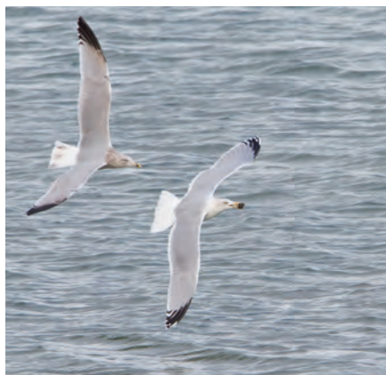
Zilvermeeuwen | Michael Kars

Hoező een ontheffing, vraagt menigeen zich misschien af. Is de zilvermeeuw dan een beschermde soort? Ja, dat is zo, want deze vogel mag dan nu algemeen zijn, dat was hij 100 jaar geleden zeker niet. Toen leefden er maar enkele duizenden zilvermeeuwen in ons land, vooral in kolonies op de Waddeneilanden. En volgens een Koninklijk Besluit uit 1902 werd hij als 'nuttig' bestempeld voor landbouw en houtteelt, omdat hij schadelijk ongedierte eet, zoals veldmuizen en engerlingen