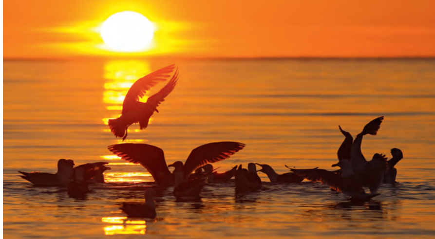
Zilvermeeuwen in zonsondergang

Voor wie minder tijd met meeuwen doorbrengt, is het op naam en op leeftijd brengen een stuk lastiger. Vooral in hun jonge jaren zijn de zilvermeeuw, de geelpootmeeuw en de Pontische meeuw moeilijk uit elkaar te houden. Het kan vier jaar duren voordat ze hun volwassen kleding dragen, en elke cyclus (of: kalenderjaar) heeft weer zijn eigen kenmerken. En tot overmaat van ramp kun je in Nederland twee soorten zilvermeeuwen tegenkomen, de Scandinavische (argentatus) en de Britse (argenteus). Wie een recent handboek over meeuwen raadpleegt, leest daar bijvoorbeeld dat 'het handpenpatroon van