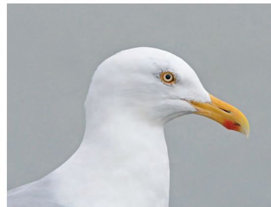
Zilvermeeuw | René de Waal