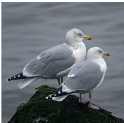
Zilvermeeuwen | Bert Geelmuijden