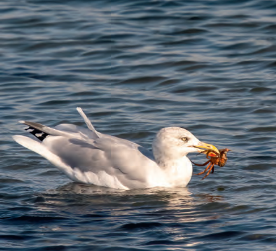
Zilvermeeuw met kreeftje

deren te verwekken bij zes partners. Volgens Camphuysen heeft elke meeuw een eigen persoonlijkheid en een eigen levensverhaal. Meeuwen zijn veel meer dan machientjes met wat vlees en veren eromheen. Het zijn individuen met een plan en met een kennissenkring. Ze kennen hun omgeving, werken samen als het moet en spelen vals als het kan - hoe menselijk!