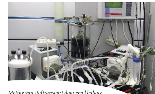
Meting van stoftransport door een kleilaag

een dichte kleilaag, bijvoorbeeld de afdichting van een slibdepot, kunnen ongewild water- en stoftransport gaan optreden door de kleilaag onder invloed van opgewekte chemische en elektrische potentiaalverschillen. Daardoor kan het depot gaan lekken. In dit onderzoek is experimenteel onderzoek gedaan: in het laboratorium met dunne kleiplakken in een zogeheten 'permeameter' en in het veld in ondiepe kleilagen en in zeer diepe, compacte kleipakketten ('Boomse klei') met behulp van piëzometers. Tevens is door bewerking van bestaande gegevens uit de literatuur nagegaan of door deze mechanismen inderdaad verontreinigingen uit een slibdepot zouden kunnen weglekken. Project 835.80.003, Chemically and electrically coupled transport in clayey soils and sediments. Projectleiders: Dr. J.P.G. Loch en Dr. R.J. Schotting, UU - Faculteit Geowetenschappen en Dr. H. Kooi, VU - Faculteit Aardwetenschappen. Looptijd: 2001 - 2005. Informatie: jpgl@geo.uu.nl .