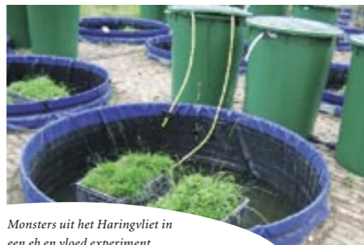
Monsters uit het Haringvliet in een eb en vloed experiment